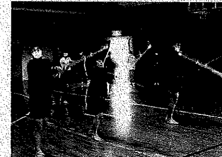
< 剣道部 >