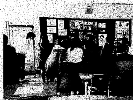
< 美術部 >