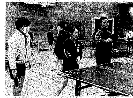
< 卓球部 >