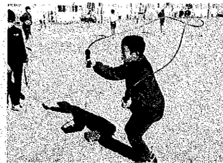
< 陸上部 >