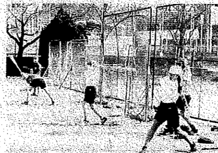
< 野球部 >