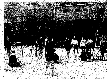
< ソフトテニス部 >