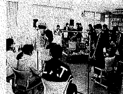
< 吹奏楽部 >