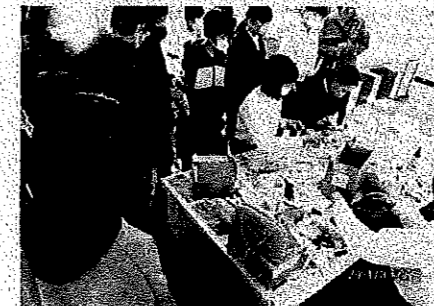
< 家庭科部 >