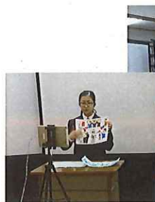
【図書室をスタジオにして】

先生方が、リモートを使うのは初の試みです。ましてや、複数の教室で一斉になると、前日までの準備・リハーサルと大変でしたが、無事終了することができました。