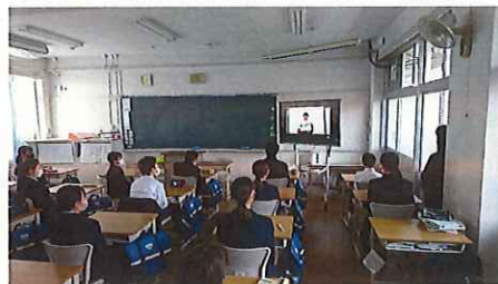
【教室で立候補者の演説を聞く1年生】