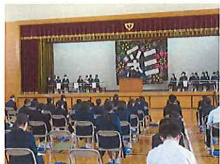
【体育館で3年生に演説】

まず、立候補者と応援者は、体育館で3年生全員に意気込みを演説しました。その様子や内容について、3年生が気付きをメモし、立候補者に渡しました。