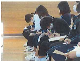
【短時間でメモをする3年生】