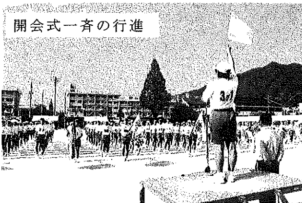
開会式一斉の行進