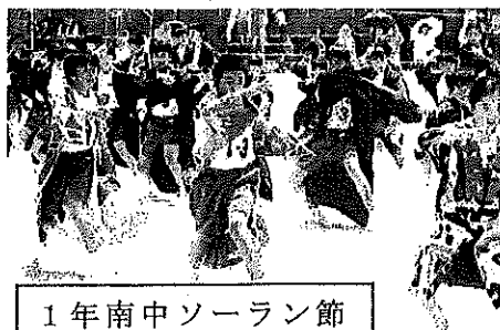
1年南中ソーラン節